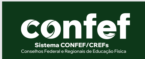
Sobre cor escura