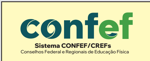
Sobre cor clara